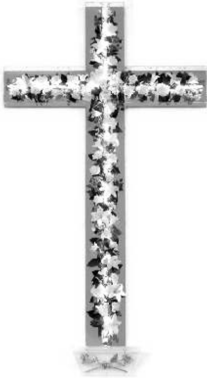
La croix lumineuse à Spiri-Maria

Aux dires des pèlerins qui s'y rendent, Spiri-Maria est, dans sa grande simplicité, un bijou artistique. Jean-Paul II déclarait, il y a quelques années: « L'Église a besoin de l'art pour transmettre son message. Elle a besoin de l'image, de la musique, de l'architecture et de l'art figuratif. » (Le Pape au risque du monde, p. 132) En plus de tous ces éléments présents à Spiri-Maria, se dresse dans le choeur une magnifique Croix glorieuse ou Croix fleurie qui correspond admirablement bien à cette description du Saint-Père: