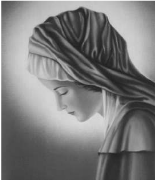
Marie, la Vierge recueillie Tableau de Sr Aline D'Amours

«"COURAGE, MON ENFANT, ENCORE UN PEU DE TEMPS. COMME IL TE FAUT SOUFFRIR