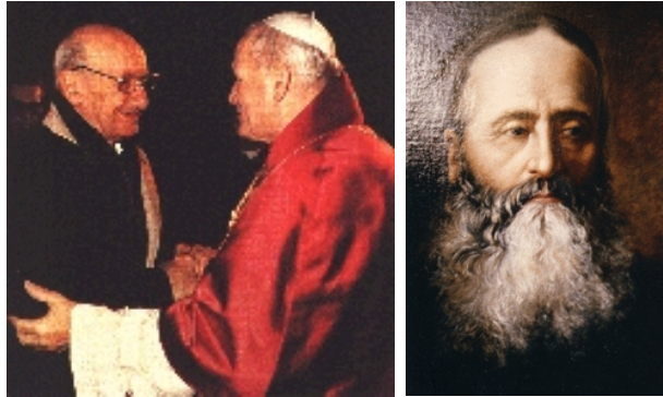
André Frossard et le Pape Jean-Paul II