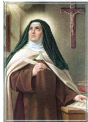
Sainte Thérèse d'Avila

conditions actuelles de vie ne représentent finalement qu'un état possible parmi tant d'autres, pullulent à travers l'histoire et des centaines de livres ne parviendraient pas à les contenir. Le plus aberrant serait donc de les ignorer ou de les considérer comme de simples légendes. Or, c'est malheureusement à ce genre d'attitude qu'en sont arrivés plusieurs de nos contemporains, après s'être laissé enivrer par l'orgueil d'une science qui avait mal évalué ses limites et qui laissait miroiter l'illusion que tous ces phénomènes étaient issus de causes naturelles qu'elle pourrait un jour expliquer. Emportés par ce vent de présomption, même s'il les accablait à une irrationalité flagrante, plusieurs ont même poussé la prétention et l'arrogance jusqu'à proposer une audacieuse réinterprétation de l'histoire dans laquelle tous ceux qui avaient vécu avant eux et qui avaient assisté à ces prodiges devaient finalement être considérés comme des fabulateurs, des imbéciles ou des illuminés.