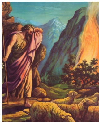
Moïse et le buisson ardent

d'être revenu à la vie après avoir été tué, même si cela demeure malgré tout un fait extraordinaire, mais d'avoir ramené la chair à cet état de grâce initial dans lequel elle se trouvait avant la chute et qui lui permettait d'avoir accès à la vie éternelle pour laquelle elle avait été conçue :