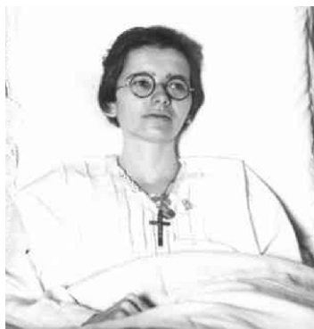
Marthe Robin au début de sa maladie

Ces exemples, démontrant que les limites de nos