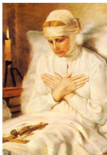
Catherine Emmerich, stigmatisée, dictant ses visions à Clément Brentano.

deux mondes de LUMIÈRE auxquels je ne me suis pas attardée, car la «vue» de notre terre m'a sidérée. Elle est emprisonnée, enveloppée d'un noir d'ébène.»