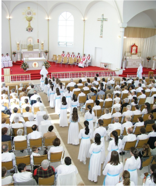
Les fillettes vont porter chacune leur petit coeur à Marie.