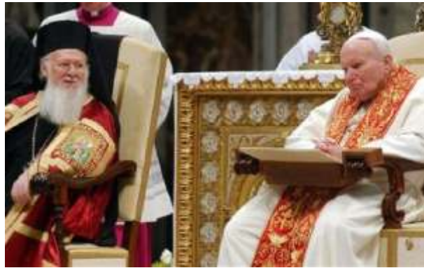
27 novembre 2004 - Sa Sainteté le Pape Jean-Paul II et le Patriarche Bartholomaïos I er lors d'une cérémonie oecuménique au Vatican.

«Dans la translation d'aussi saintes reliques, nous voyons une occasion bénie pour purifier nos mémoires blessées, pour renforcer notre