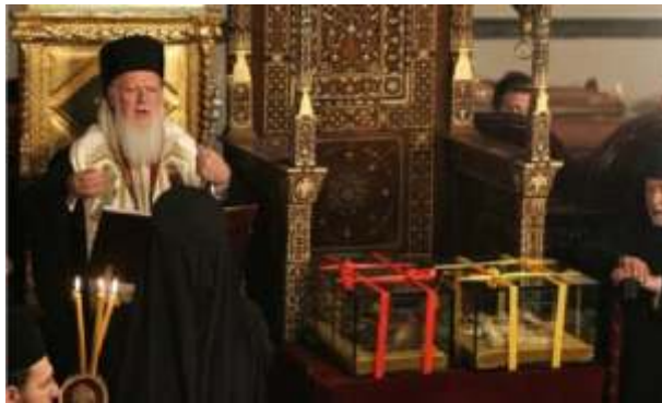
Le Pape Jean-Paul II a remis au Patriarche Bartholomaïos I er les reliques de saint Grégoire de Nazianze et de saint Jean Chrysostome, conservées au Vatican depuis plusieurs siècles.

chemin de réconciliation, pour confirmer que la foi de ces saints Docteurs est la foi des Églises d'Orient et d'Occident. Nous y voyons également l'heure propice pour «montrer avec des paroles et avec des gestes d'aujourd'hui les immenses richesses que nos Églises conservent dans les trésors de leurs traditions».