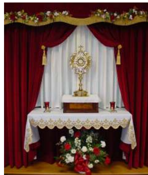
Trône eucharistique à la chapelle des Soeurs de Notre-Dame de la Charité.

Je ne savais pas les détails de votre départ. Dans le monde des affaires et de la politique, il y a souvent des situations qui ont l'air injustes. Je suis très heureux que vous soyez venu à Hot Springs. Je crois que