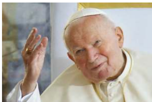
Sa Sainteté le Pape Jean-Paul II

Voici ce qu'il dit: «L'envoi à la fin de chaque messe [ici, le Saint-Père fait référence à l' "Ite Missa est" . "Ite" , littéralement: "Allez, vous êtes envoyés"] constitue une consigne qui pousse le chrétien à s'engager pour la diffusion de l'Évangile et pour l'animation chrétienne de la société. Pour une telle mission, l'Eucharistie ne procure pas seulement la force intérieure, mais aussi – en un sens – le projet. Elle est en effet une manière d'être qui, de Jésus, passe chez le chrétien et, par le témoignage de ce dernier, vise à se répandre dans la société et dans la culture.