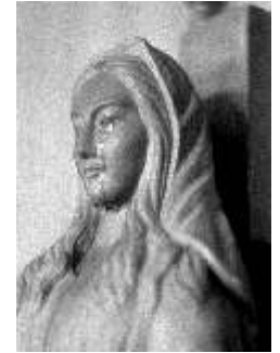
La statue de la Dame de Tous les Peuples qui a pleuré 101 fois au Japon.

Ainsi se réalisent les paroles du Seigneur à Marie-Paule: «L'ÉGLISE EST PARALYSÉE PAR LA MESQUINERIE DES ÉVÊQUES» ( Vie d'Amour , vol. IX, chap. 43, p. 185, 1974) et celles de Marie à Akita, au Japon: «CARDINAL CONTRE CARDINAL, ÉVÊQUE CONTRE ÉVÊQUE...» (Shimura Tatsuya, La Vierge Marie pleure au Japon (Akita) , Suisse, Éditions du Parvis, 1985, pp. 44-45) À noter que la statue de la Vierge, représentant la Dame de Tous les Peuples, a pleuré