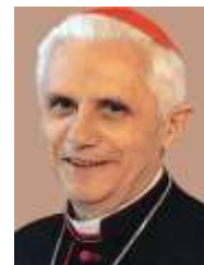
S. Ém. Card. J. Ratzinger