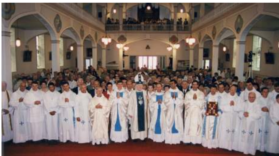
14 août 1999 - Église Notre-Dame-de-l'Assomption, Arichat, N.-É. Photo de groupe à l'issue de l'ordination sacerdotale de quatre Fils de Marie - trois prêtres et un diacre - conférée par S. Exc. Mgr Colin Campbell.

grande discrétion, le silence et le calme, là où l'ivraie des calomnies n'est pas semée..., et l'ordination a lieu le 14 août 1999.