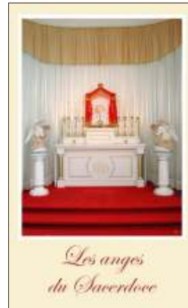
Prière pour les prêtres

Lors du récent triduum de prières tenu à Spiri-Maria, les 27, 28 et 29 mai dernier, sous le thème: «L'Eucharistie et les anges du sacerdoce», ce feuillet de prière et cette petite image ont été offerts à tous les participants.