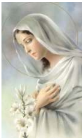
B5-4-29: image pieuse B2-12: plaquette laminée

Vous sont aussi offertes des plaquettes laminées fabriquées à partir de ces mêmes images, plaquettes identiques à celles qui ont été portées en procession lors des fêtes solennelles de septembre dernier.