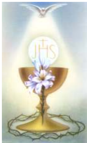
B5-3-12: image pieuse B1-7: plaquette laminée

B5-4-29: La Vierge au Lys (sans prière) – Prix: 26¢ + taxes = 30¢