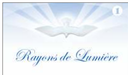
E8-7-1 (recueil #1) – E8-7-2 (recueil #2) – E8-7-3 (recueil #3)