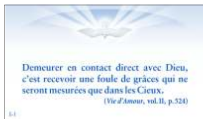
Modèle d'une petite carte avec une pensée

Tous ces articles sont disponibles aux librairies de l'Armée de Marie ou au Rosier d'Or: 1273, 22 e Rue, Québec QC G1J 1T1 Tél. et téléc.: (418) 524-3214 (frais de poste en sus)