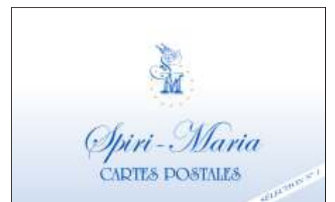
E6-22: paquet de 6 cartes (sélection #1) E6-23: paquet de 6 cartes (sélection #2) E6-24: paquet de 6 cartes (sélection #3)