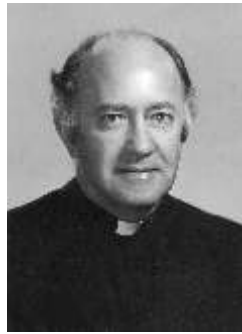
1973 - À l'âge de 53 ans