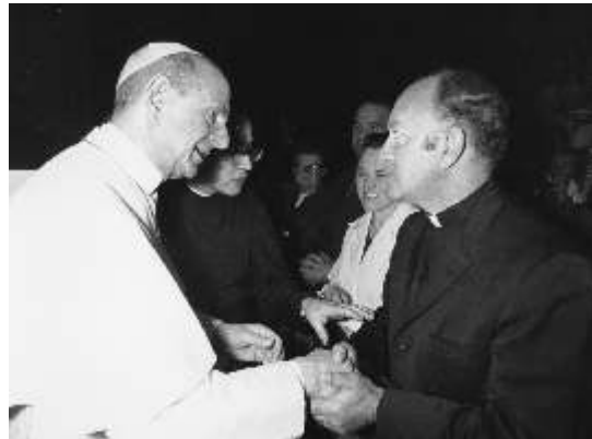
1973 - Sa Sainteté le Pape Paul VI saluant l'abbé Mélançon lors d'une audience.