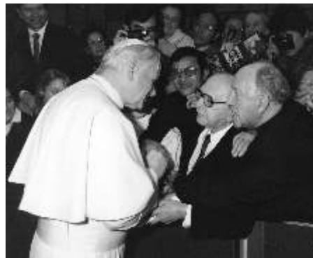
1985, Rome - Raoul Auclair et l'abbé Lionel Mélançon présentent à Sa Sainteté Jean-Paul II le livre L'Homme Total dans la Terre Totale .

l'Oeuvre, communiquant aux Chevaliers de Marie son sens de l'Histoire vue à la lumière de Dieu.