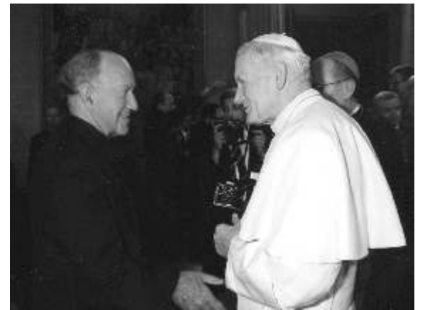
1985, Rome - L'abbé Mélançon avec Sa Sainteté le Pape Jean-Paul II.