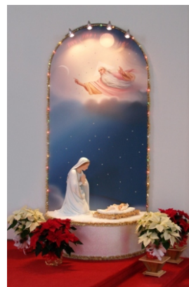
Crèche à Spiri-Maria