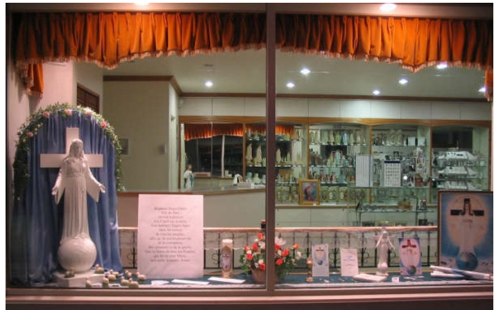
Vitrine en l'honneur de la Dame de Tous les Peuples, Le Rosier d'Or, 22 e Rue, Québec

Voici la relation d'un événement assez surprenant qui s'est produit le 24 janvier, alors que nous venions de terminer la préparation de la vitrine du magasin: