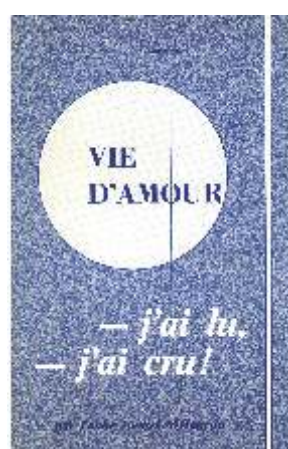
Vie d'Amour: - j'ai lu, - j'ai cru! par l'abbé Lionel Mélançon 48 pages - Prix: 3$