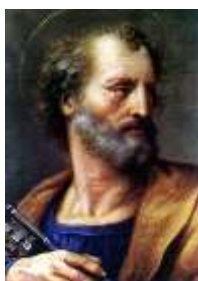
Saint Pierre Apôtre