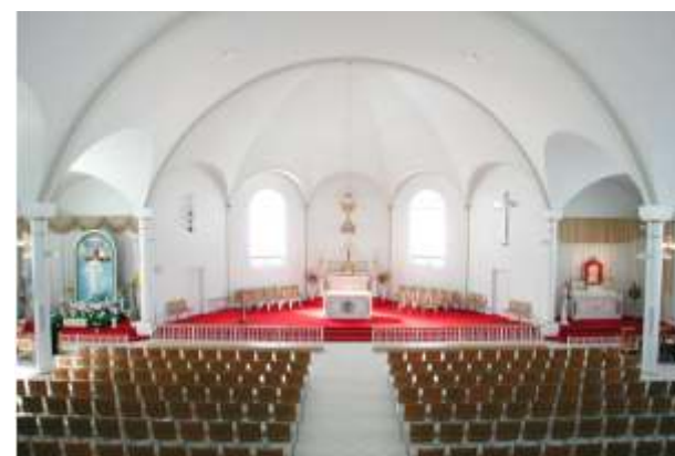
Chapelle de la Dame de Tous les Peuples à Spiri-Maria, Lac-Étchemin

Sainte Hildegarde a annoncé cette purification et contemplé l'âge d'or qui suivra: