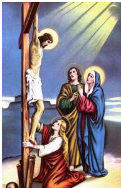
L'Apôtre saint Jean, Marie, notre Mère, et Marie Madeleine, au pied de la croix du Rédempteur