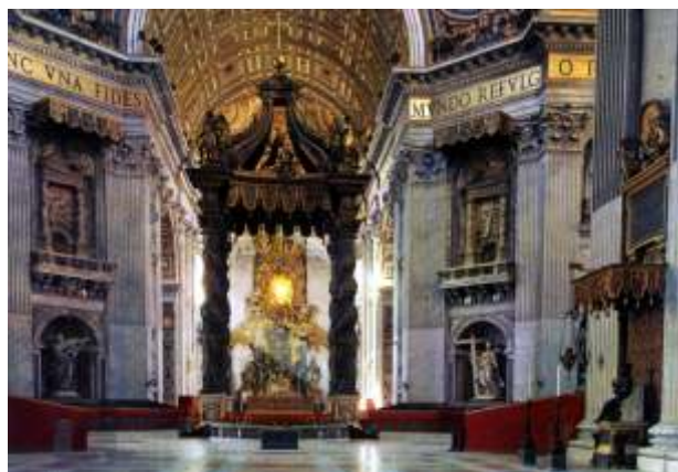
La Gloire du Bernin dans l'abside de la Basilique Saint-Pierre de Rome

«L'Église de Jean, c'est l'Église renouvelée de Pierre. Elle vit déjà sous l'influence de l'Esprit Véritable dans l'Amour qui embrasait les cœurs de Jésus et de Jean, de cet Amour qui scella le pacte voulu par le Rédempteur entre Marie, notre Mère, et Jean l'Évangéliste.»