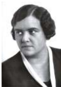
Adrienne von Speyr