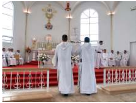
L'Agneau de l'Apocalypse, symbole de l'Église de Jean, est porté dans le chœur par deux Fils de Marie.