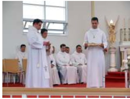
Après la remise de la médaille, c'est la bénédiction du ceinturon.