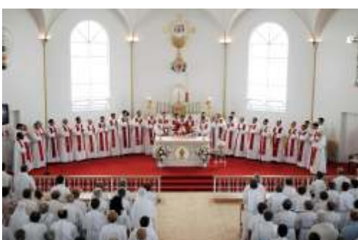
Le chant du solennel «Sanctus» unit d'un même cœur les célébrants.