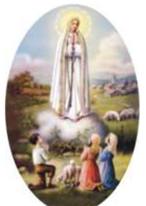
1917 - Fatima