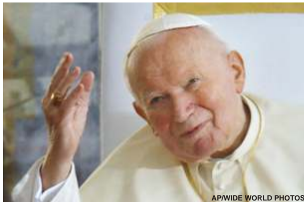
«L'espérance de la Paix» Le Pape Jean-Paul II

Un des signes les plus manifestes de la décadence de la vie politique des nations est celui-ci: l'Europe refuse, contre toute évidence, d'inclure dans sa Constitution la simple mention de ses origines chrétiennes. Le Pape Jean-Paul II et, à sa suite,