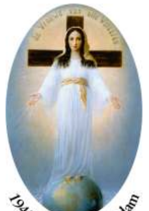
1945-1959 - Amsterdam

sens de l'image, du message et de la mission de la Dame de Tous les Peuples.