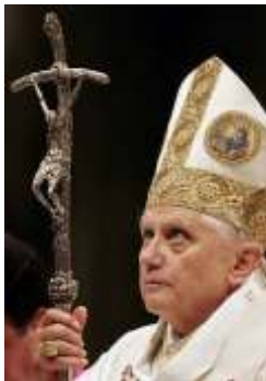
Pape Benoît XVI

le Pape Benoît XVI ont demandé avec insistance que la Constitution de l'Europe reconnaisse le rôle du christianisme dans la fondation des nations européennes. Ce refus obstiné (qui est surtout le fait de la France, chef de file dans ce domaine) s'inscrit dans les conséquences du laïcisme exacerbé qui empoisonne progressivement la vie des nations depuis plusieurs décennies.