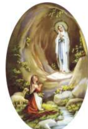
1858 - Lourdes