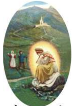
1846 - La Salette