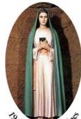
1947 - Trois-Fontaines