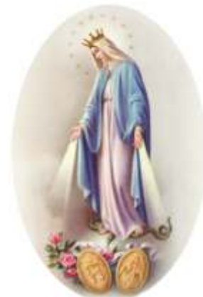
1830 - Paris