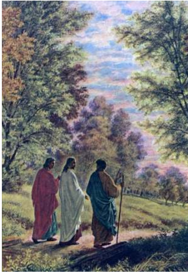
Rencontre de deux disciples avec Jésus sur le chemin vers le village d'Emmaüs.

Jésus agit délibérément dans ce sens en faisant l'«éducation post-pascale» de ses apôtres et de ses disciples: «Or, tandis qu'ils parlaient et discutaient, Jésus lui-même s'approcha, et il marchait avec eux. (...) « Vous n'avez donc pas compris! (...) Votre coeur est lent à croire. »» (Lc 24, 15.25) Il est clair que Jésus n'adopte pas la méthode intellectuelle des disciples trop portés vers la discussion et la compréhension cérébrale. Eux discutent, mais Jésus, dans un premier temps, se contente de marcher avec eux, de leur faire vivre l'expérience qu'il est avec eux. Présence réelle de Jésus au milieu d'eux. La foi du coeur comme attitude primordiale du cheminement spirituel. Le résultat ne se fait d'ailleurs pas attendre: «Leurs yeux s'ouvrirent, et ils le reconnurent.» (Lc 24, 31)