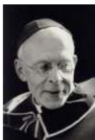
Cardinal Charles Journet

Dans son ouvrage monumental sur L'ÉGLISE DU VERBE INCARNÉ 1 , le Cardinal Journet évoque le fait qu'une excommunication peut être prononcée hors de la vérité et de la justice, reconnaissant que «la supposition la plus délicate est celle d'une excommunication prononcée par erreur contre un innocent ( injusta ex causa ). Elle n'ôtera point à cet homme le plus grand des biens, c'est-à-dire l'amour, qu'on n'enlève à personne malgré lui. En conséquence, elle ne le privera pas de cette communion aux biens spirituels de l'Église qui est fondée sur la charité. On pourra penser en outre, avec de bons théologiens, qu'elle ne le privera même pas de cette autre communion aux biens spirituels de l'Église, fondée sur l'application spéciale que l'Église en fait à ses enfants. L'innocent, "légitimement excommunié" sur des preuves apparemment convaincantes, en vérité n'est pas excommunié, et il n'est pas privé des prières et des suffrages communs de l'Église.» (Dominique Soto, IV Sent. dist 22, qu. 1, a. 3, concl. 4.)