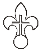
1986 Les Oblats-Patriotes