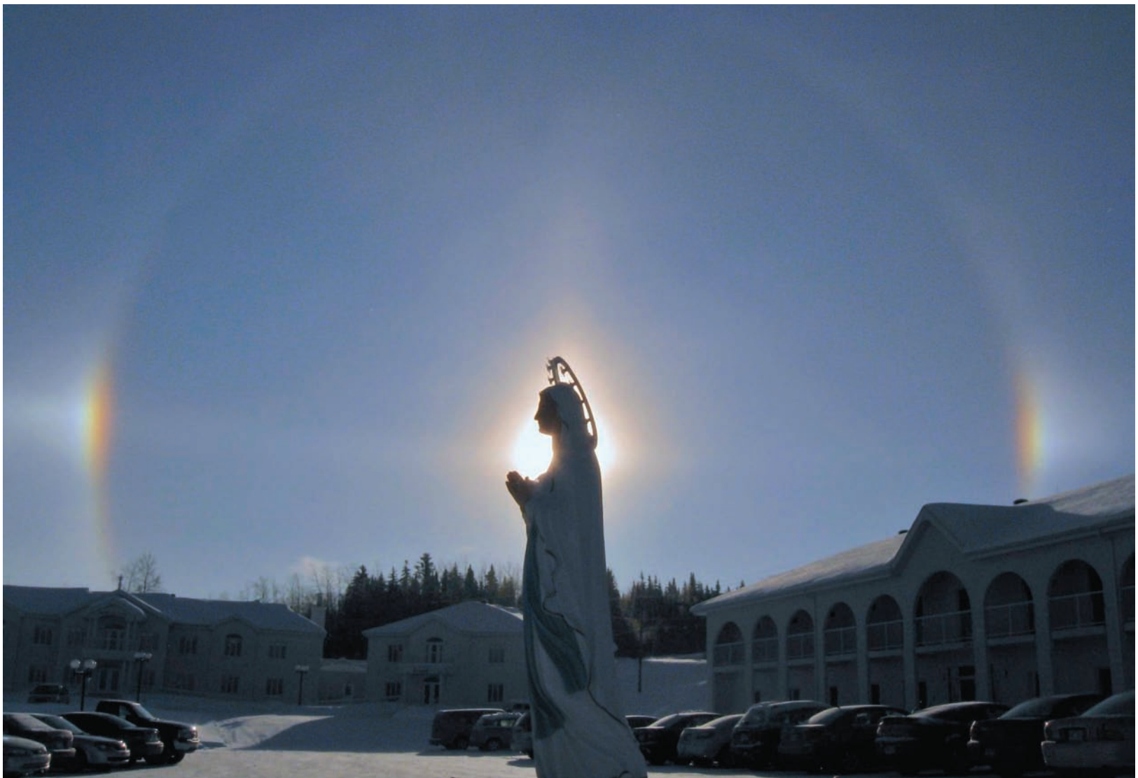
13 décembre 2008, Spiri-Maria, Lac-Etchemin - L'Immaculée illuminée par un arc-en-ciel qui unit par ses couleurs et son symbolisme Spiri-Maria à la Résidence de la Dame.