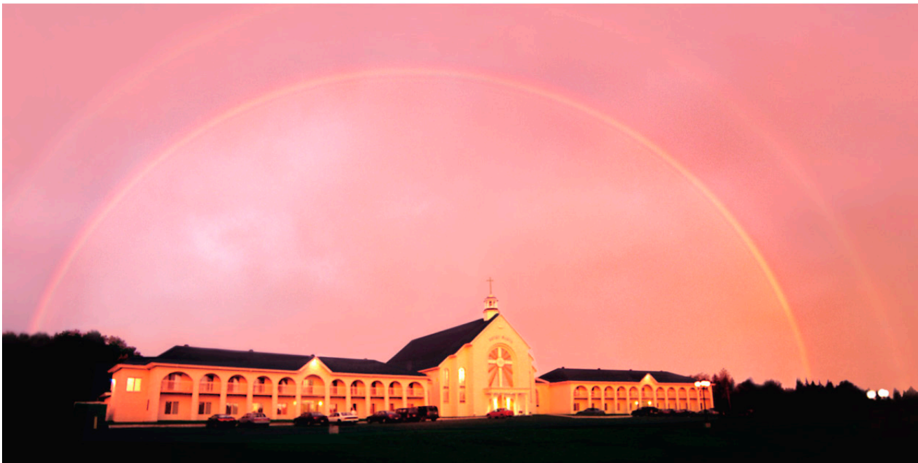
Spiri-Maria, Lac-Etchemin, 2 septembre 2000 - Très tôt le matin, un lever du soleil hors de l'ordinaire s'étend d'une manière inattendue et provoque une aurore jamais vue.

C'est donc en fixant le Chef-d'Oeuvre de Dieu dans une incessante union d'amour que les peuples parviendront à n'avoir qu'un seul et même coeur tout en conservant l'héritage qui leur est propre, car tout reflétera alors, pour la plus grande gloire de Dieu, l'Ordre parfait réa-lisé par l'unité dans la diversité. Ainsi, le regard